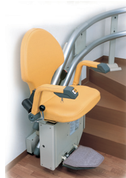
いす式階段昇降機